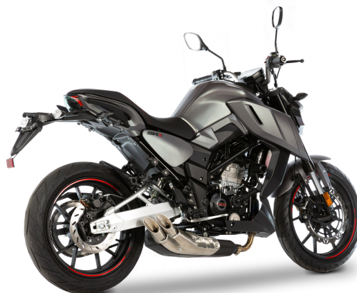
SK01 125cc "Portfolio"